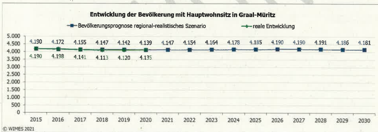
Abbildung 1: Entwicklung der Bevölkerung mit Hauptwohnsitz in der Gemeinde Graal-Müritz

Die Bevölkerungszahl der Gemeinde ist seit dem Jahr 2015 weitestgehend konstant. Diese wird auch für den Planungs- und Prognosezeitraum angenommen.