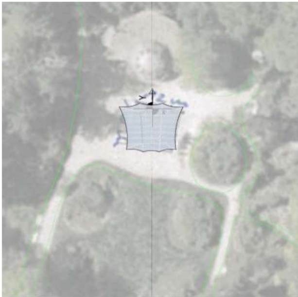
LP/ Grundriss. Michael Kiefer, Freier Architekt. Copyright.

Die beiden folgenden Bilder zeigen eine erste Konzeption. Bei Beauftragung werden wir alternative Möglichkeiten untersuchen. Die hier gezeigte Idee ist mein geistiges Eigentum und darf nicht von Dritten genutzt werden. Michael Kiefer.