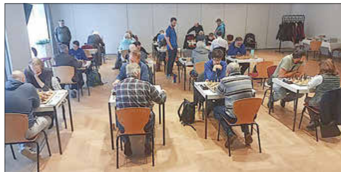
Unsere Spielstätte im Haus des Gastes