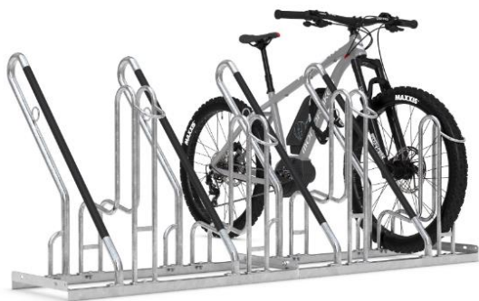
Nr. 2) Anlehnparker 4700 XBF von Schilderwerk Beutha GmbH