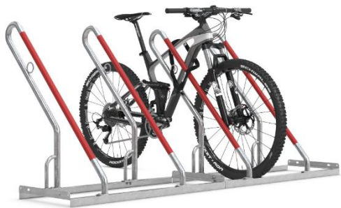
Nr 1) Anlehnparker 0500 XBF von Schilderwerk Beutha GmbH