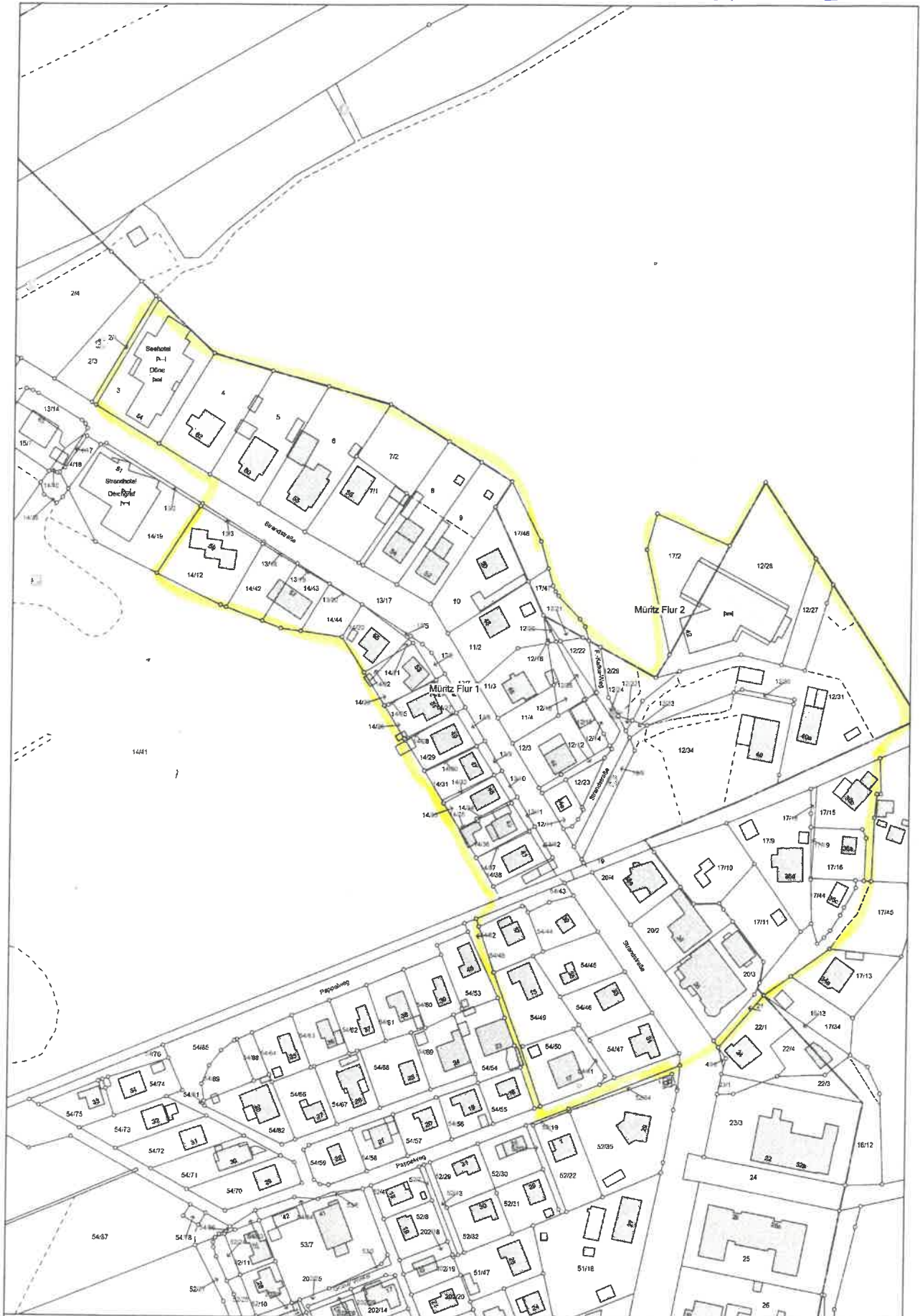
Auszug aus dem Katasterkartenwerk