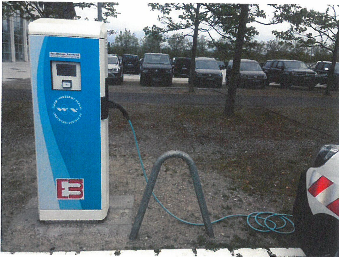
Beispiel Hansestadt Rostock (Messehalle)