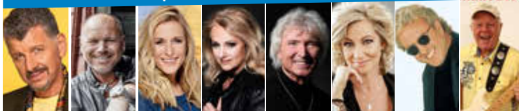
Semino Rossi, Olaf Henning, Stefanie Hertel, Nicole, Peter Orloff, Claudia Jung, Bernie Paul und Graham Bonney

Weitere Infos unter: www.schlager-kanaren.de