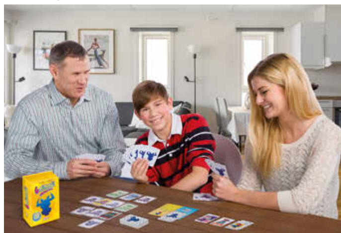
Kartenspiele machen der ganzen Familie Spaß. Man spielt, je nach Edition, gegeneinander oder als Team.

(DJD). Kartenspiele sind bei Menschen jeden Alters beliebt. Bis zu zehn Personen können bei dem schnell zu lernenden Klassiker „6 nimmt!“ von Amigo mitspielen. Zum 30-jährigen Geburtstag hat der Verlag eine neue, kooperative Variante herausgebracht, bei der alle Spielerinnen und Spieler gemeinsam gewinnen oder verlieren. Beim Basisspiel geht es darum, geschickt die vier vorliegenden Zahlenreihen zu ergänzen – aber nicht mit mehr als fünf Karten, sonst gibt es Minuspunkte. Bei der in der Jubiläumsedition enthaltenen Variante spielen alle gemeinsam gegen den Büffel und versuchen, ihm die Minuspunkte zuzuschustern. 2024 findet erstmals auch eine „6nimmt!“-WM statt. Wer daran teilnehmen möchte, kann auf www.amigo-spiele.de , unter dem Reiter „Events“ alle wichtigen Informationen nachlesen.