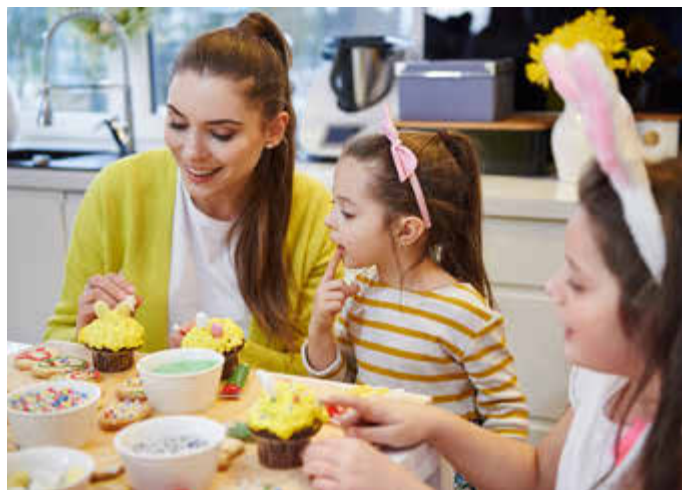
Vielfältige traditionelle Leckereien aus der Osterbäckerei versüßen uns das Osterfest.

(DJD). Dass gerade zum Osterfest süße Osterbrote, Hefekränze, Lämmchen und Osterzöpfe gebacken werden, hängt mit der christlichen Tradition dieses Festes zusammen. „Das Osterfest folgt auf die lange, karge Fastenzeit, in der früher viele Nahrungsmittel wie Milchprodukte oder gesüßte Gebäcke kirchlich untersagt waren. Ostern durfte wieder geschlemmt werden“, weiß Bernd Kütscher, Bäckermeister und Direktor der Bundesakademie des Deutschen Bäckerhandwerks. Etwas Salz darf im Teig beim Backen nicht fehlen, da es den Geschmack verbessert und die Aromen intensiviert. Zudem trägt Salz zur Regulierung der natürlichen Fermentation im Teig bei. Auch die Teigstruktur wird gestärkt, was sich auf das Gebäckvolumen auswirkt. Weitere Infos gibt es unter www.vks-kalisalz.de .