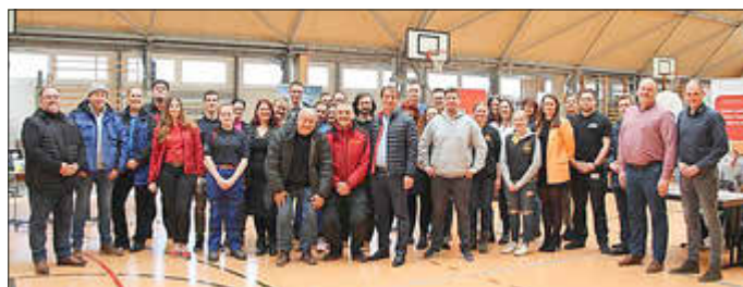
Aussteller des letzten Jahres