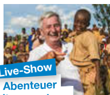
Live-Show Abenteuer Weltumrundung